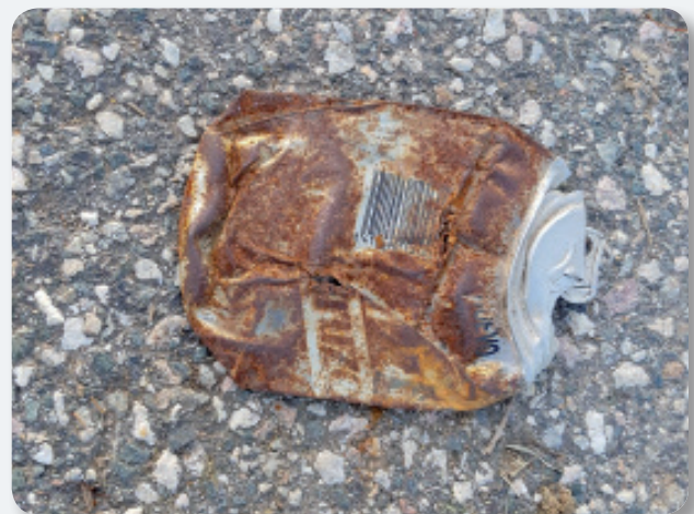
Objetos mayoritarios totales – Most commonly found objects

Tapas y tapones plastic – Estibaliz López Samaniego points out that “this data is still preliminary, given that the area studied represents less than 10% of the total territory. With the implementation of the eLitter app for mobile devices in 2018 and the continuation of the field campaigns initiated in 2017, the aim is to increase the quantity of information so that it is sufficiently representative to enable data analysis to commence. The quantification of this environmental problem will enable identification of the waste type, where it occurs, where it comes from and the design of measures to minimise it.”